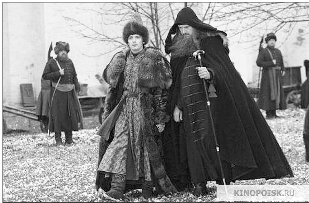
Кадр из фильма.

Археографы Москвы и Петербурга всегда удивлялись, как нам удаётся работать здесь в Сибири, ведь сибирское старообрядчество гораздо более закрытое сообщество, чем где-либо. Кто бежал в Сибирь, оставляя обжитые места, организованное хозяйство? Люди непреклонно настроенные, уходившие от царства антихриста — не важно, царя или патриарха. Поэтому сибирское старообрядчество всё-таки отличается от остальной российской части. Однако в реальной жизни старообрядец, несмотря на довольно жёсткие идеологические установки, очень практичный человек. Старообрядцы всегда были хорошо экономически организованы. Например, Выговский монастырь в голодные годы кормил весь русский север. Организация хозяйства по монастырскому принципу и никакой отчуждённости от мира, кроме духовной, конечно, — это позволило им прекрасно экономически обустроить жизнь общин. Наиболее известные купцы и предприниматели Российской империи — все были старообрядцами. ■