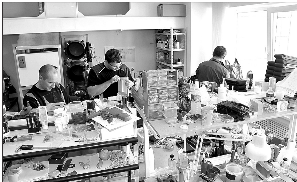
Прототипирование нового изделия — тоже процесс творческий.