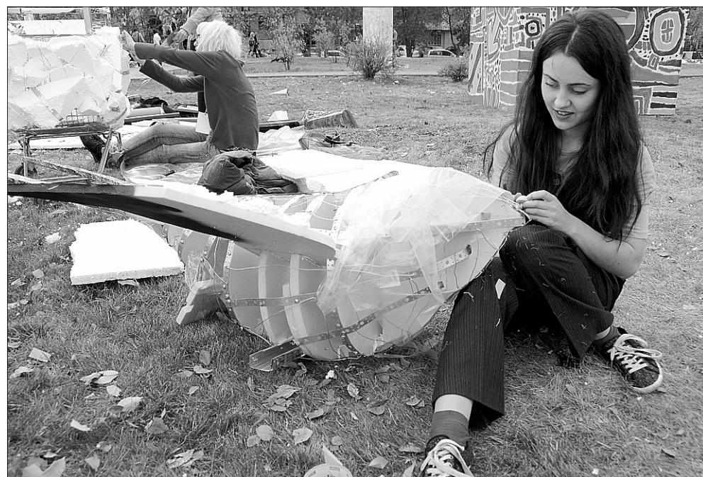
Скоро ласточка обрестёт крыльями и полетит по ночному Новосибирску, переливаясь светодиодами.