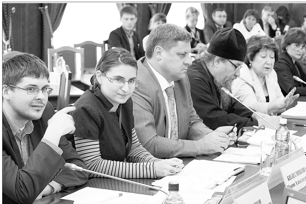
Среди участников дебатов было много молодёжи.