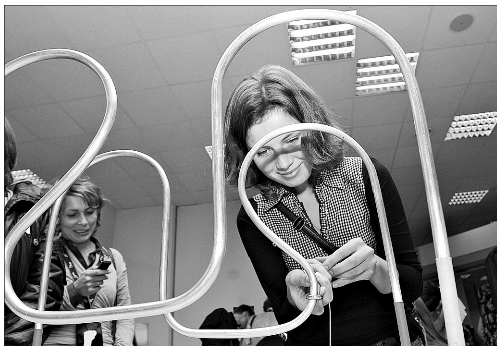
На «Интерре» каждый испытал себя по-своему.

хорошей бизнес-школой для 600 участников. Заключено соглашение о целевом наборе в открытый университет Сколково студентов из вузов Новосибирска и Томска. Подано большое количество заявок на получение инвестиций в компанию «Главстарт», партнёра Российской венчурной компании. Заключен проект соглашения о создании научно-образовательного консорциума, куда вошли НГУЭУ, НГТУ, ТУСУР, Московский институт мировой экономики и международных отношений и Курчатовский институт, для продвижения русских инноваций на мировом рынке.