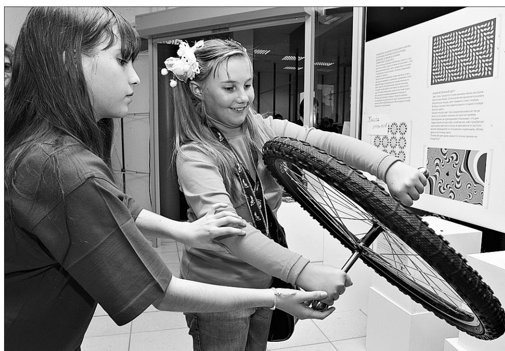
Самым популярным у школьников стал «музей занимательных наук».

Мероприятия проекта «Сибирское Сколково. Тройная спираль» (НГУЭУ) стали