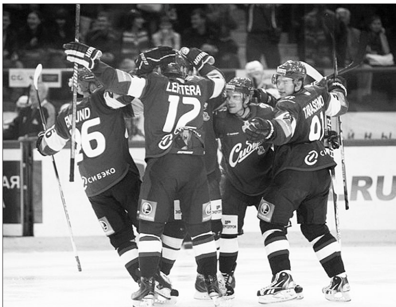
21.09.2011. «Сибирь»—«Салават Юлаев» — 5:4. Ликует первая пятёрка хозяев.