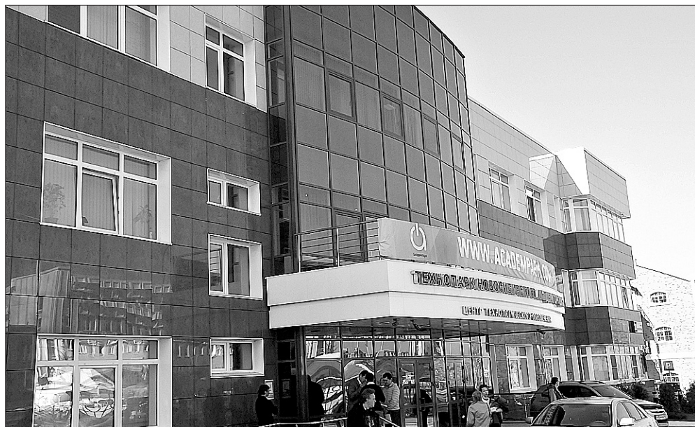
В Центре технологического обеспечения технопарка готовы помочь любому бизнесмену.